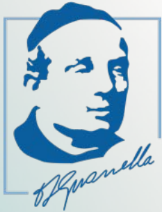
‘La profecía de la pobreza evangélica’