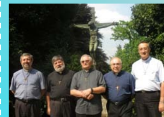
Noticias de Consejo General