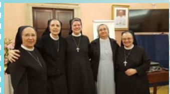
‘18º Capítulo General de las HSMP’