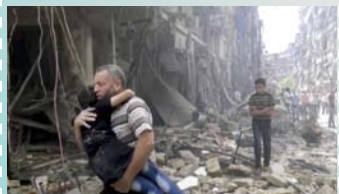
‘La Pía Unión del Transito de San José’

Nosotros conocemos muy bien el pensamiento del Fundador sobre la pobreza: "Nuestra Obra comenzó como iniciativa de la Providencia de Dios, que nunca fallará, siempre que no nos alejemos del espíritu original, que es el espíritu de mucha pobreza y de gran confianza en la providencia de Dios".